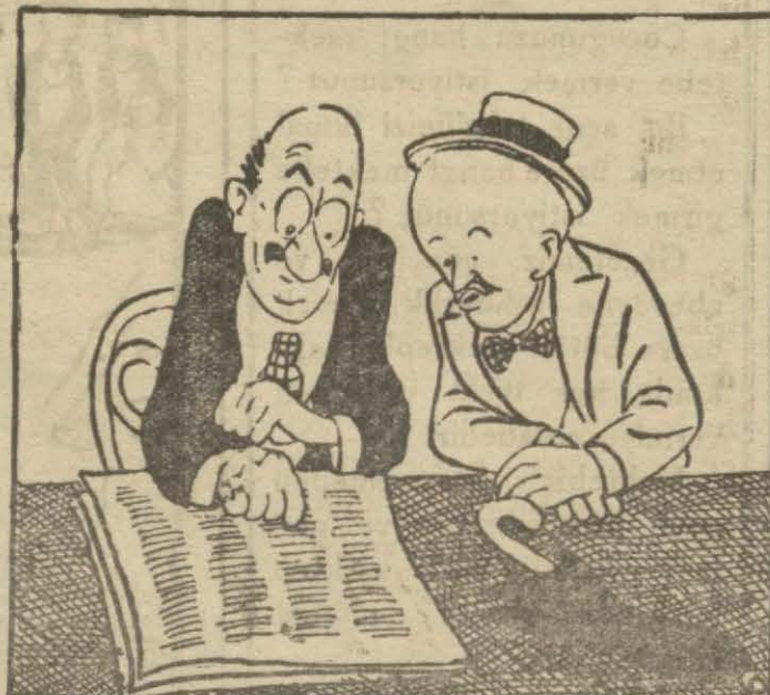
2: Komşu — "Türk Ceza Kanununun 587 inci maddesinin birinci fıkrasındaki suçlarla ikinci babının 192 inci ve üçüncü faslının birinci babında..