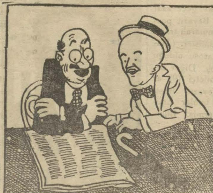
3: Komşu — "Ve 286 inci maddenin ilk fıkrası ve 287 inci madde ve altıncı babının üçüncü faslında yazılı..