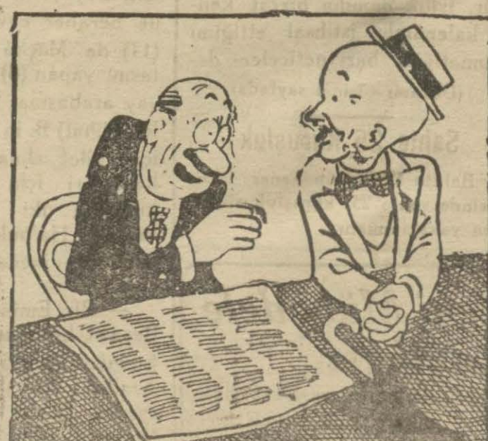
4: Hasan Bey — Dur yahu.. Böyle 67 maddelik kanun yerine bir tek madde kâfidi: "Tenkit ve muhalefet yapan gazeteye rahat yoktur.."