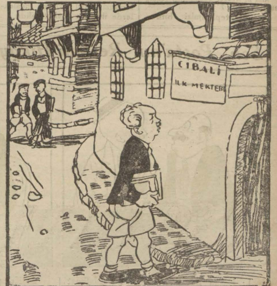
F. Rifki B. Cibali ilkm ktebinde tahsilini ikmal edecektir.

Yeni Kanun Mucibince Tahsile Mecbur Olanlar: Seri 1 - No. 1