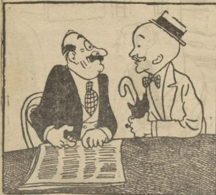
1: Hasan Bey — Yahu... Şu Matbuat Kanununu bir daha oku da can kulağı ile dinleyim.